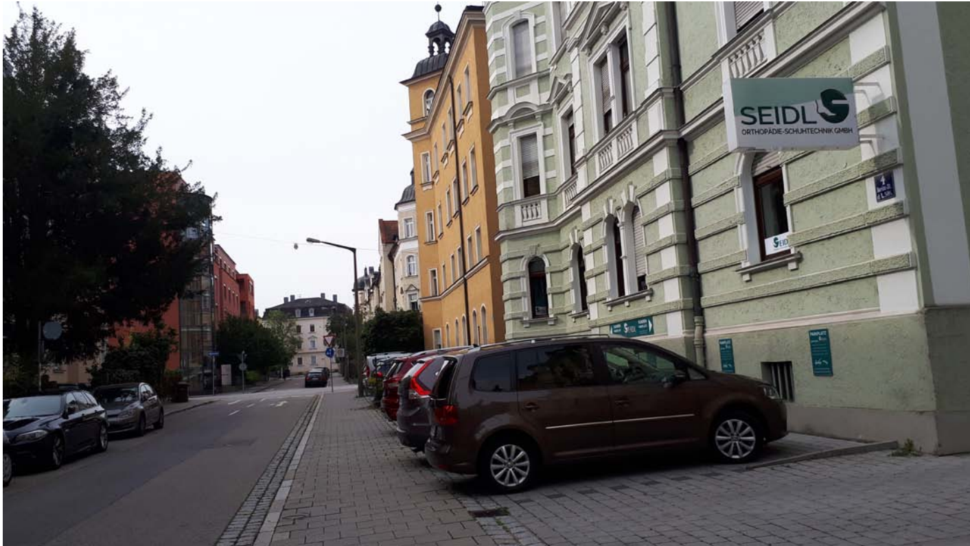
ehem. gründerzeitliche Vorgärten in der Roritzer Straße- heute Parkplatz