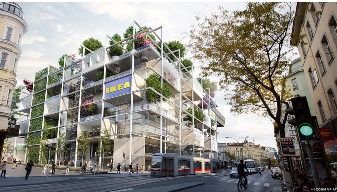
Konzept Neubau Ikea Mariahilferstraße Wien