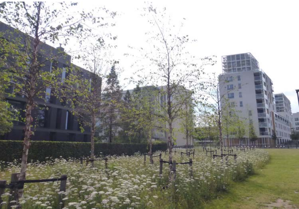
Wiesensäume in einem Neubaugebiet in Antwerpen