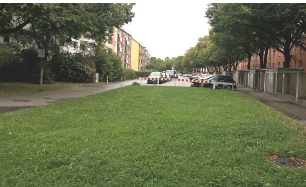
Der grüne Korridor am Burgunderring wartet auf seine Fortführung