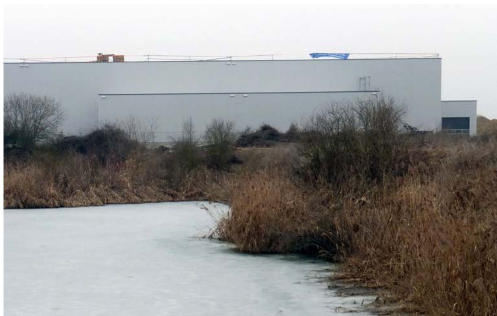
Die Klärteiche bei Irl sollen erhalten und weiterentwickelt werden