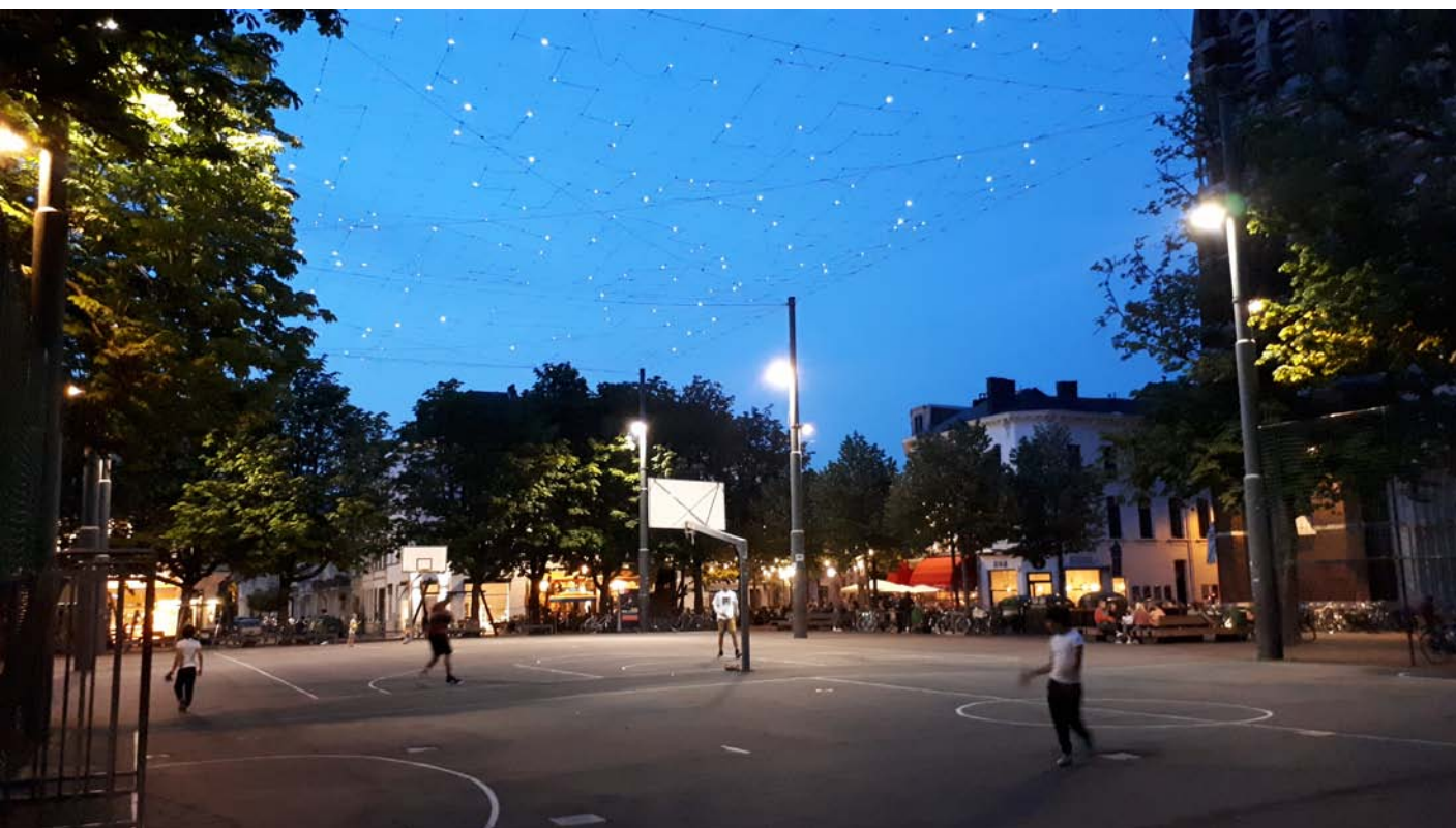
Multifunktionsplatz in innerstädtischem Quartier in Antwerpen

Freiräume sind heute multifunktionale Räume, mögliche Funktionsüberlagerungen müssen geprüft und entwickelt werden