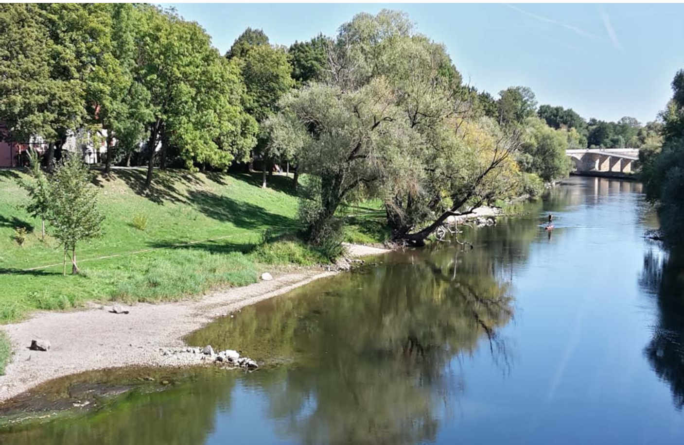
Die gelungene Ufergestaltung des nördl. Donauarms im Bereich der Wöhrde Retentionsraum und Naherholung