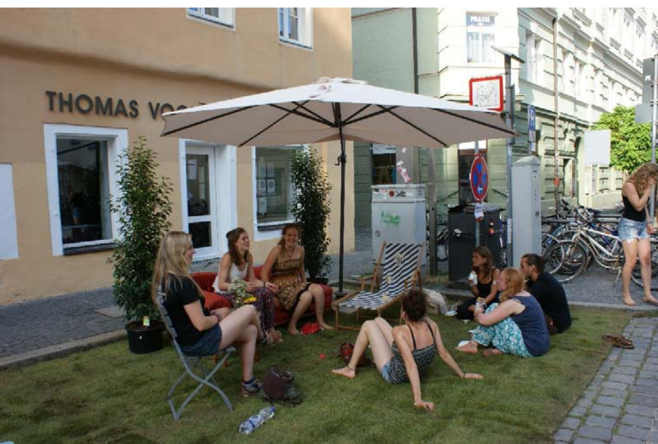
Aktion von Transition und VCD in der Obermünsterstraße

Der motorisierte Individualverkehr ist weiterhin der größte Flächenverbraucher der nicht bebauten Flächen in Regensburg, daher gilt: Nachhaltige öffentliche Räume brauchen die Verkehrswende. Voraussetzung dafür sind öffentliche Räume, die nachhaltige Mobilität attraktiv machen.