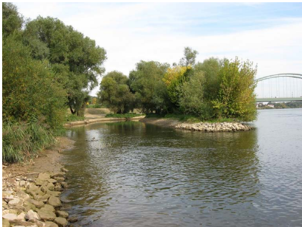
Bei Schwabelweis wurde im Zuge des Hochwasserschutzes ein Seitenarm der Donau angelegt. Es hat sich gezeigt, dass dies einen wertvollen Beitrag zur Bewahrung der Artenvielfalt geleistet hat. In diesem Seitenarm finden sich in großer Zahl seltene Fischarten.